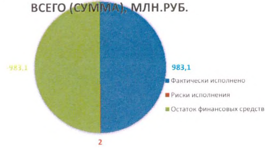
КОНСОЛИДИРОВАННЫЙ БЮДЖЕТ НАО НА (ДАТА) ВСЕГО (СУММА), МЛН.РУБ.

Фактически исполнено 0 Риски исполнения 1 Остаток финансовых средств 0